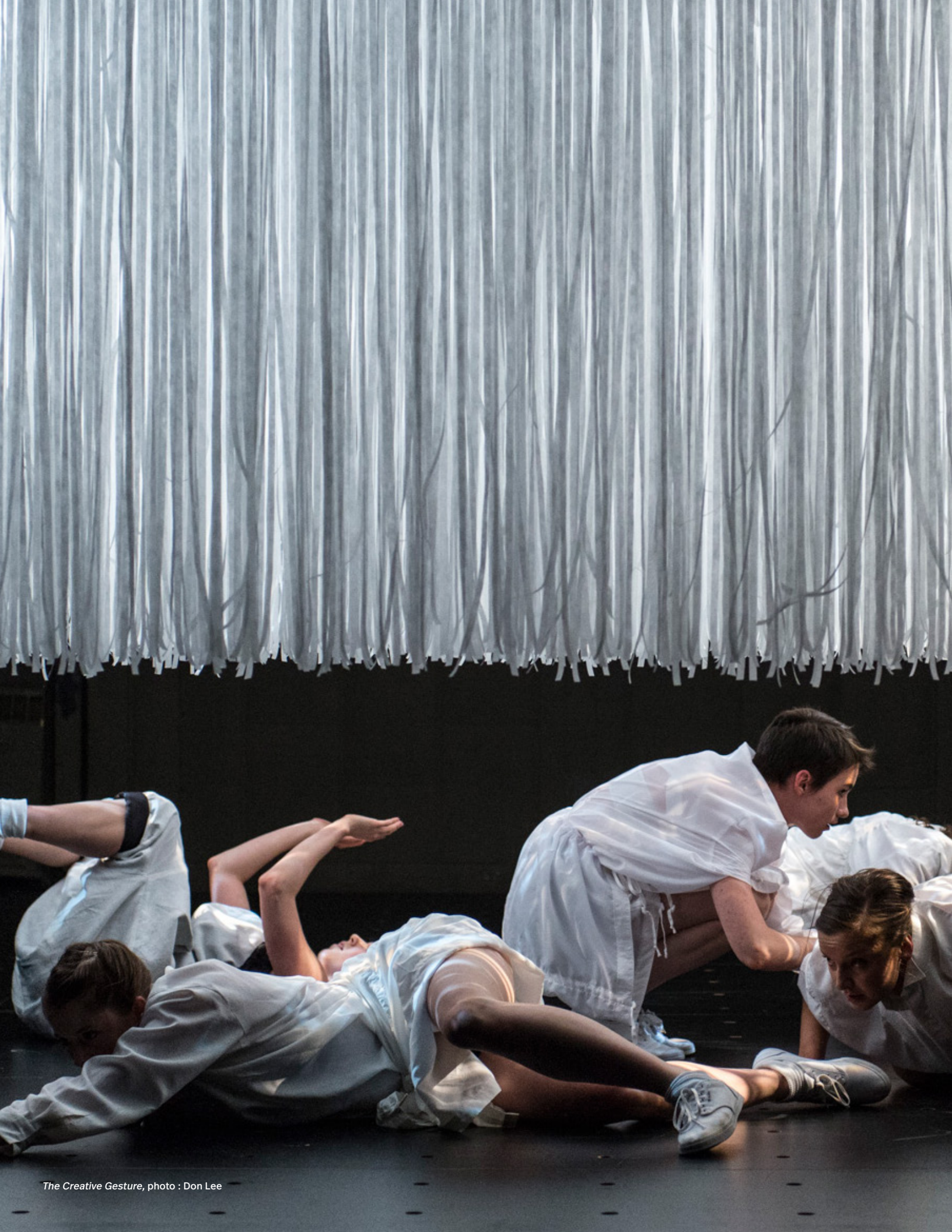
The Creative Gesture